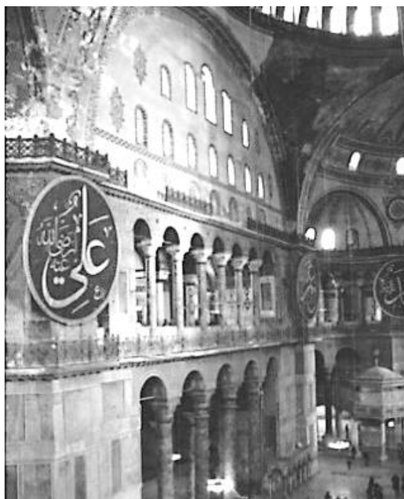
کل ۲: نمای درونی ایاصوفیه از سمت غرب به سوی راهروی شمالی

بر اثر ویرانی‌ها و تعمیرات پی در پی، بخشی از موزاییک‌های «ایاصوفیه» از میان رفته است؛ از جمله تابلوی موزاییک تصویر حضرت عیسی مسیح، که در ۱۳۵۵م آن را بر سطح داخلی گنبد ساخته بودند. این اثر گویا تا میانه سده ۱۷م نیز بر جای بوده و در زمان سلطان عبدالمجید، قاضی عسکر عزت‌افندی با نوشتن آیاتی از سوره «نور» آن را پوشانده است. همچنین بخش‌های برنزی به‌کاررفته در قسمت جنوبی کتابخانه آثار هنری نفیسی به‌شمار می‌آید. دیوارهای این بخش را تخته سنگ‌های ارزشمند و گران‌قیمتی پوشانده که قدمت آن به قرن چهاردهم میلادی بازمی‌گردد. شکوه و زیبایی «ایاصوفیه» پیوسته توجه جهان‌گردان را به خود جلب کرده است. امروزه نیز از مراکز مهم جهانگردی دنیا و از منابع بزرگ درآمد دولت ترکیه به‌شمار می‌رود.