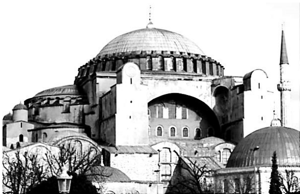
شکل ۳: نمای بیرونی مسجد ایاصوفیه